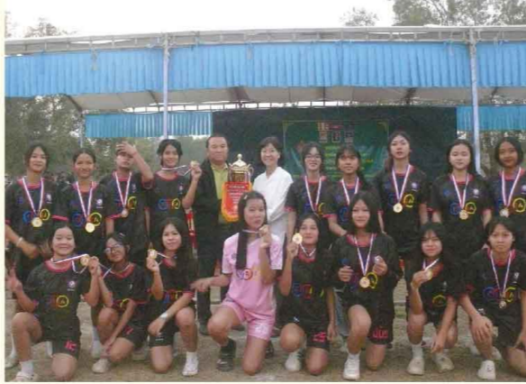
▲ 女子足球隊於縣級比賽中勇奪冠軍

感謝知風草中學，還有認真教學的老師們，最後感謝所有認同教育、捐助資源的捐款人們，提供了我們這個學習環境。■